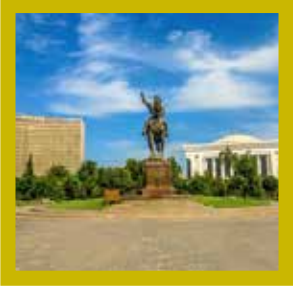
Emir Timur Meydanı Taşkent

Timur, tarihin en büyük cihangirlerinden biriydi. Zamana ve zemine göre değişen siyasi bünyeyi geliştiren, kalabalık orduları fetihlere yönelten etkili bir devlet adamı, askeri bir taktikçi ve strateji uzmanıydı. İslam medeniyetinin en önemli şehirlerinden biri olan ve bugün Özbekistan sınırları içinde bulunan Semerkant'ı "dünya şehri" haline getirmek için büyük çaba göstermişti.