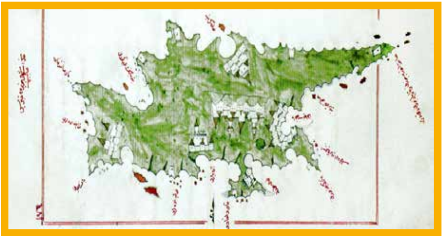
Piri Reis'in Kitâb-ı Bahriyye'sinde Kıbrıs'ı gösteren harita

Kıbrıs Adası'ndaki İngiliz yönetimi ise, Osmanlı İmparatorluğu'nun 1878'de adayı İngiltere'ye kiralamasıyla gerçekleşmiştir. Bu kiralama süreci de Osmanlı İmparatorluğu'nun özellikle Balkanlar, Karadeniz, Doğu Anadolu toprakları Rus tehdidi altına girmesi ve Kırım Savaşı ile başlamıştır. İngilizler adaya İngiliz kraliçesi tarafından atanan Sir Garnet Wolseley komutasında bir kuvvetle 22 Temmuz 1878'de Larnaka'dan çıktı. Adada bir direniş olmaması için padişah fermanı gönderildi ve İngiliz subaylar bu fermanı birer örnek ile adaya çıktılar ve Kıbrıs'taki 308 yıl süren Türk egemenliği tamamen bitmiştir.