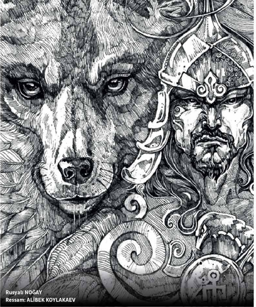
Rusyalı NOĞAY Ressam: ALİBEK KOYLAKAEV